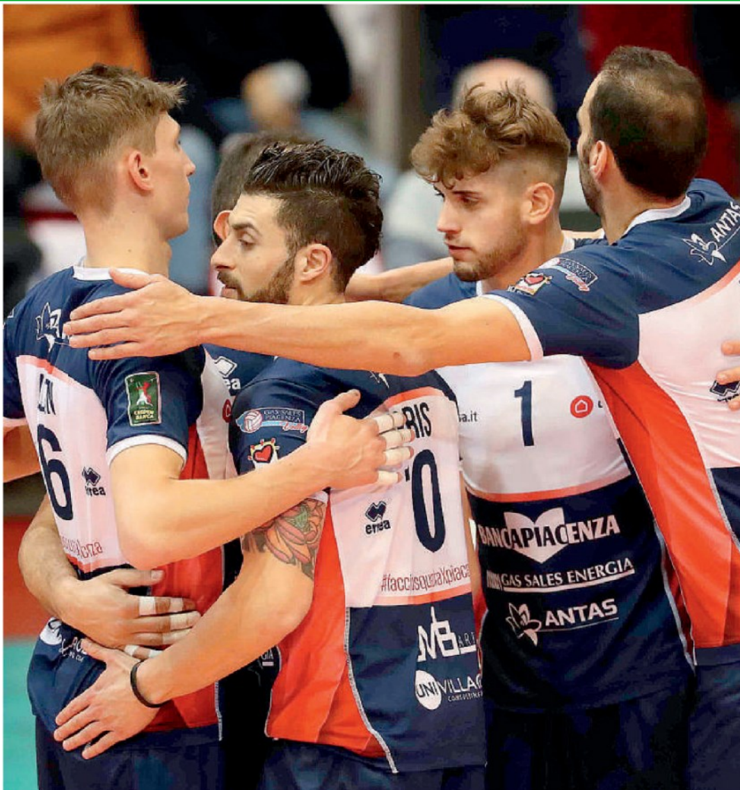
L'esultanza dei giocatori della Gas Sales Piacenza al termine della partita