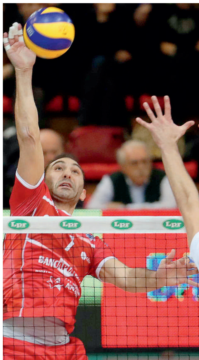
Una schiacciata di Mercurio FOTO CAVALLI