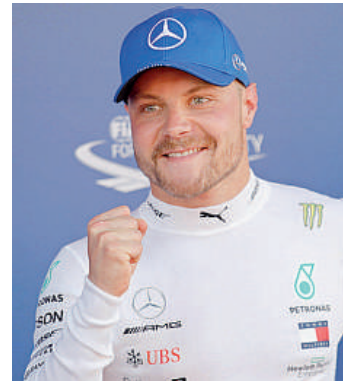
Terza pole di fila per Valtteri Bottas

«Il terzo settore per noi è più che un tallone d'Achille. Il bilanciamento è azzeccato, ma soprattutto quel che ci manca su quel tipo di curve è al momento il grip. Abbiamo messo giù tutto il potenziale, ma evidentemente non siamo abbastanza ve-