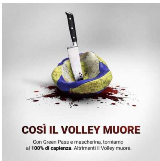
Il Ct Roberto Mancini sostiene la campagna "Così il volley muore"