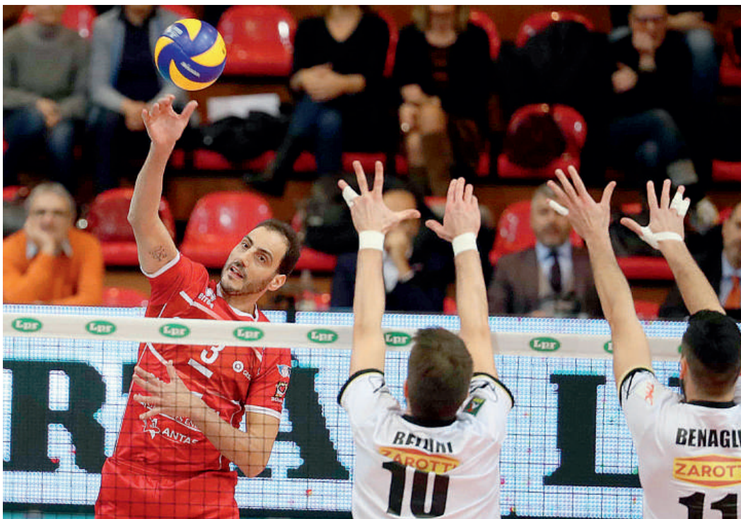
Fei ha dato ancora una volta spettacolo stavolta sfidando a distanza Prolingheuer