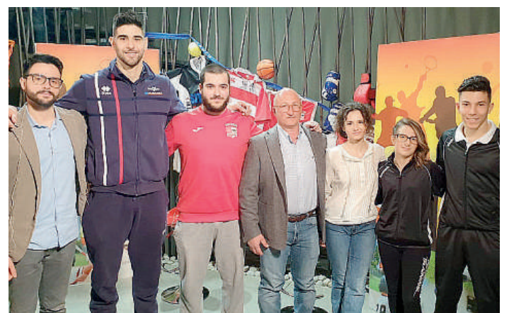
Gli ospiti della trasmissione di ieri sera